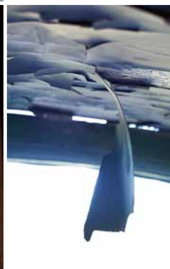
T.v. Graffiti på dörren till orkesterlogen från 1700-talet.