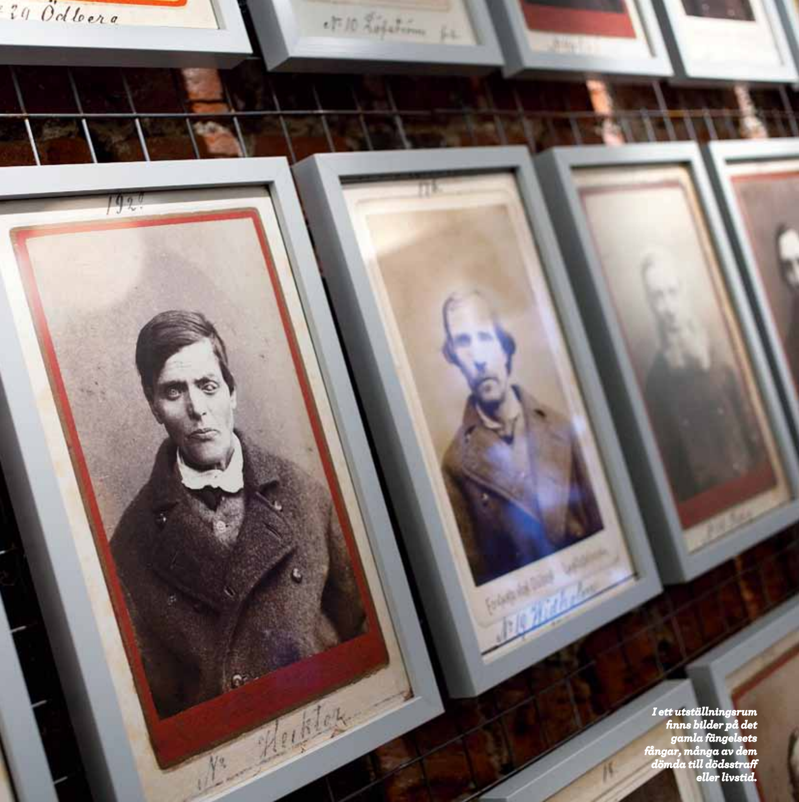
I ett utställningsrum finns bilder på det gamla fängelsets fångar, många av dem dömda till dödsstraff eller livstid.

är spännande att få levandegöra det som är svenska folkets egendom, för att människor ska förstå sin historia. Landskrona är dessutom en stad som inte haft det så lätt under de senaste decennierna. Citadellet är något som landskronaborna kan vara stolta över och som ger turistintäkter.