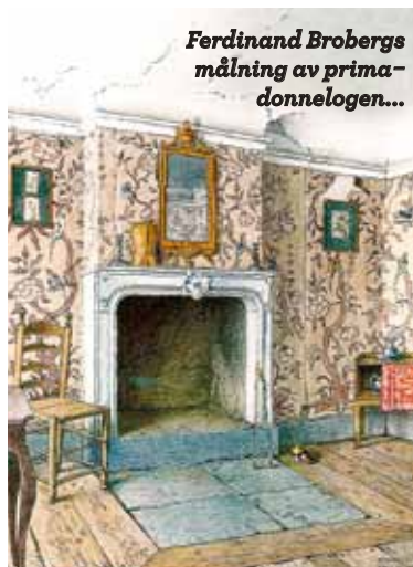
Ferdinand Brobergs målning av prima- donnelogen...