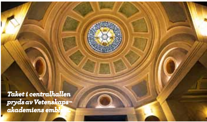
Taket i centralhallen pryds av Vetenskapsakademiens emblem.