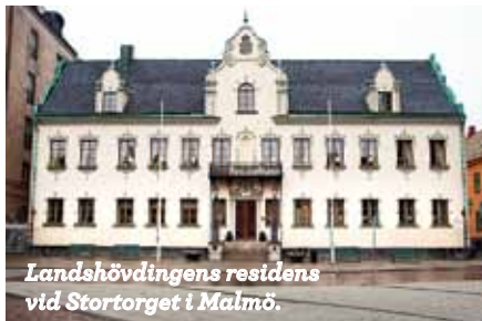
Landshövdingens residens vid Stortorget i Malmö.