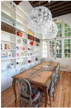
Strindbergrummet är ett intimt och charmant mötesrum.