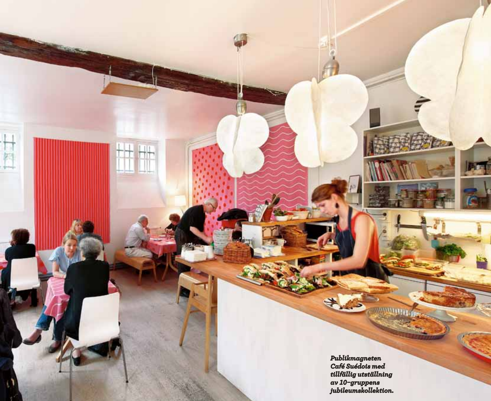
Publikmagneten Café Suédois med tillfällig utställning av 10-gruppens jubileumskollektion.

hur man lyckats nå kvantifierbara mål med begränsade medel.