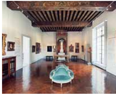
Kristinasalen har ett vackert, välbevarat tak med målade takbjälkar.