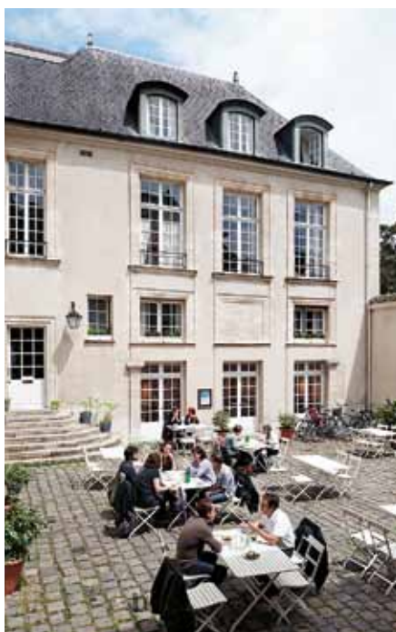
Hôtel de Marles stenbelagda innergård är en vacker och uppskattad oas.

Den pågående utställningen om designprinsen Sigvard Bernadotte, pionjären som tydliggjorde värdet av god form och designstrategier inom svenskt näringsliv, får också positiva kommentarer av sällskapet. Här finns