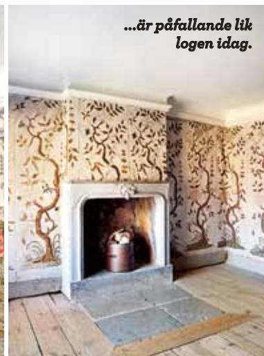
...är påfallande lik logen idag.