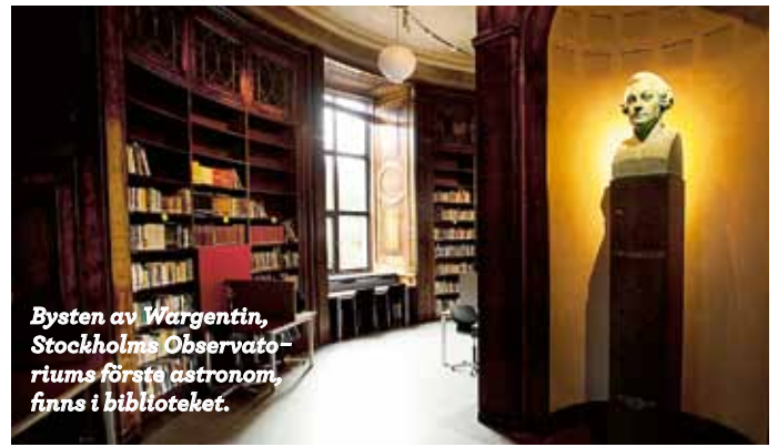
Bysten av Wargentin, Stockholms Observatoriums förste astronom, finns i biblioteket.

med varandra. Och vi hade vår egen lilla värld här uppe, det kom inte så många andra förbi eftersom vägen hit upp är så brant och dryg att gå.